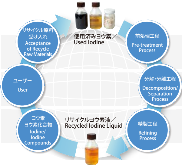
使用済みヨウ素リサイクル工程／The Process for Recycling Used Iodine

The furnaces and hydrogen iodide (HI) recycling equipment are controlled and monitored by a central processing unit.