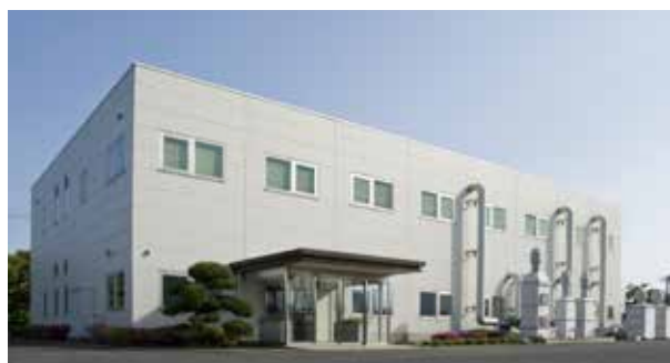
技術研究所 Techno Research Center

Under our goal of being comprehensive solutions provider for iodine, we have accumulated wide-ranging expertise and a high-level of technological process since our founding. We actively partner with universities and other firms to pursue the hidden potential of iodine. In these endeavors, we make use of our high-level analytical capabilities, advanced analytical devices, basic research and industrialization processes, and demonstration equipments that can meet the needs of composite materials under contract.