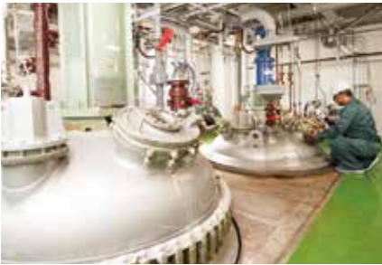
ヨウ素酸塩製造設備 Iodate Manufacturing Equipment

ヨウ化カリウムおよびヨウ化ナトリウムの新製法による製造技術を確立し、高品質の製品を供給しています。また、ヨウ化カリウムは、GMP対応の第二工場でも製造しています。 We provide high-quality potassium iodide and sodium iodide produced using new manufacturing methods. We manufacture potassium iodide at the second facility, which the production management system comply with the GMP standards.