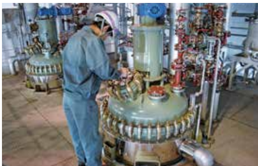
少量製造設備 Small-quantity Products Manufacturing Equipment 10~500Lの製造設備を活用し、大・中・少量の製品の製造が可能で、お客様の多様なニーズにお応えします。 Utilizing the manufacturing equipment with the capacity ranging from 10 to 500 liters enables manufacturing of products in a large, medium or small quantity, thereby responding to customers various needs.