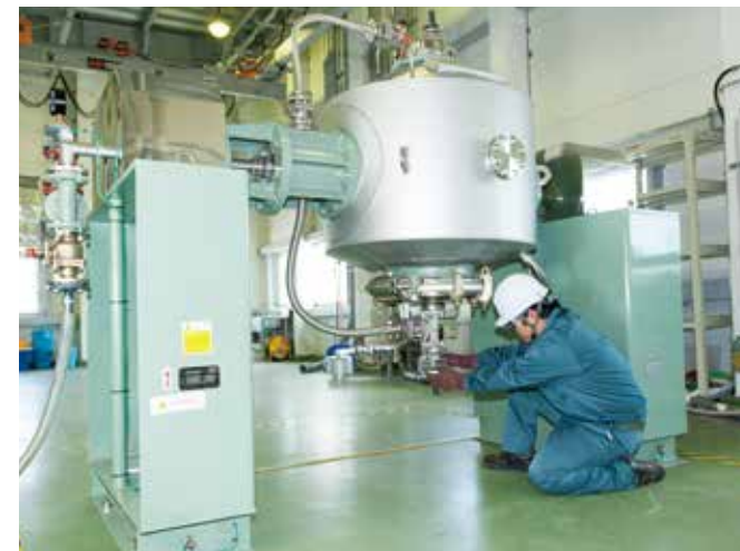
濾過乾燥機 / Filtering and Drying Machine

さまざまな試料形態の分析を行っており、とりわけヨウ素を含有する試料の分析には豊富な技術とノウハウの蓄積があります。(登録番号：千葉県第637号) We conduct analysis using various sample configurations, and possess a wealth of technologies and accumulated expertise in the analysis of samples containing iodine. (Registration number: Chiba Prefecture No. 637)