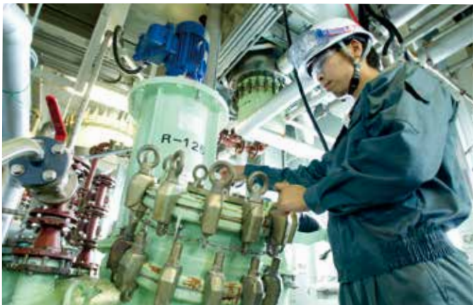
反応缶／Reaction Can 原料を反応させるだけでなく、液体製品の受器、また反応後の処理操作に使用します。 This equipment is used not only to cause reactions of ingredients, but also as a receiver for liquid products and for disposal operations after reactions.