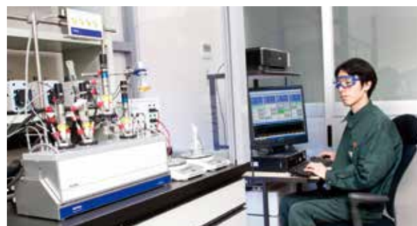
自動合成装置 Automated Synthesizer System

This device is used to analyze the structure of organic compounds and study chemical reactions. It enables observation of changes in the magnetization of the nucleus of each atom, and is used to obtain necessary information on atomic particles.