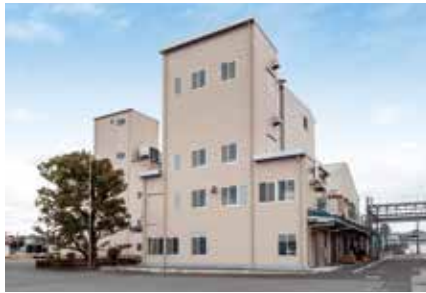
KI・NaI製造設備 KI and NaI Manufacturing Facility

ヨウ化カリウム(タブレット品) Potassium Iodide 非固結性に優れ、高品質で市場から高い評価を得ています。 Its superior non-coagulating properties and high quality make it a popular product.