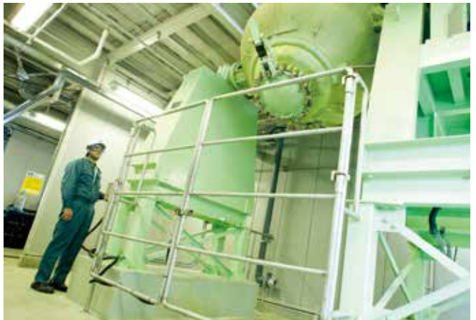
回転乾燥機／Revolving Dryer Machine 内側がガラスライニングで、外側に温水や蒸気を流すジャケットがあり、粉体製品の乾燥に使用します。 With an inner glass lining and an exterior jacket to wash away warm water and steam, this machine is used to dry powder products.