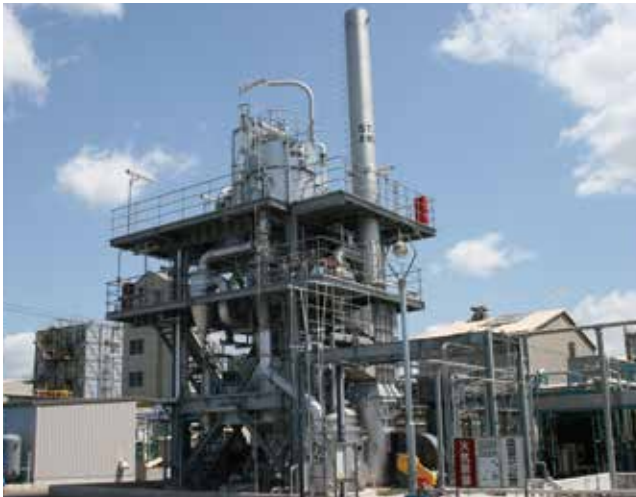
液中燃焼設備／Submerged Combustion Equipment

Materials containing iodine are dissolved or filtered, then dried to recover the iodine.