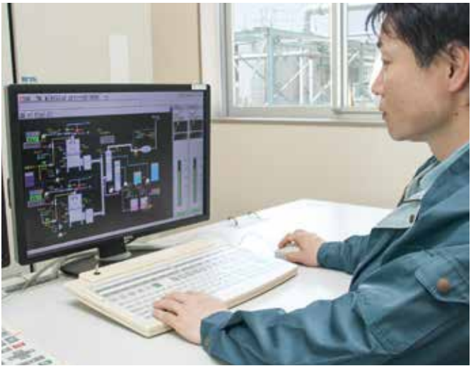
リサイクル計装室／Recycling Instrument Room