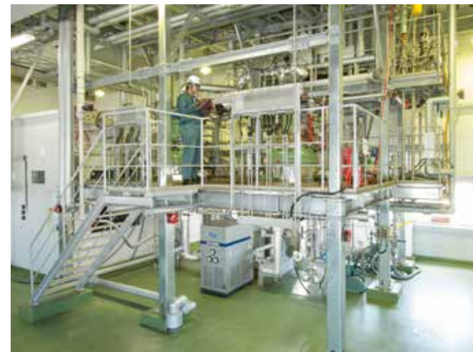
有機中実験設備 / Pilot Plant for Organic Iodine Compounds

With our system covering from the filtration, washing, drying, we provide high-grade sample of several hundred kg of scales.