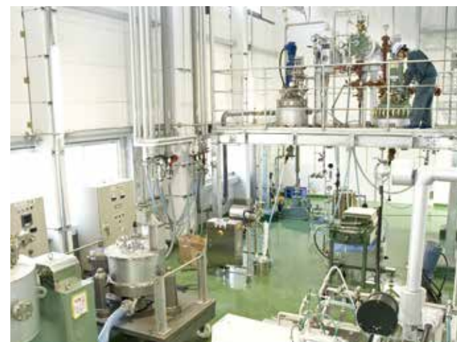
リサイクル中実験設備 / Pilot Plant for Iodine-Recycle

We strive for iodine compounds manufacturing and research and development that gives rise to new products.