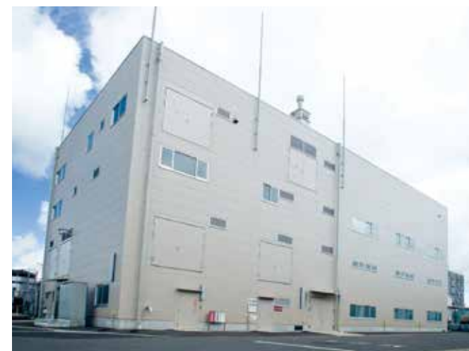
技術開発センター / Technology Development Center

This equipment is where we conduct development and testing of processes for factory production of organic iodine compounds.