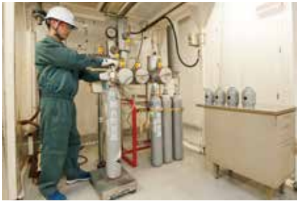
高純度ヨウ化水素ガス製造設備 High-Grade Hydrogen Iodide Gas Manufacturing Equipment 不純物となる金属を一切使用しない製法により製造するため、品質の安定性に優れています。 We manufacture our high-grade hydrogen iodide gas without using any metals that could introduce impurities. This ensures an extremely reliable, high-quality product.

触媒や飼料添加物として需要の拡大が見込まれているヨウ素酸塩類等を製品化し、幅広いニーズに応えています。 We offer iodate products to meet a wide-range of needs. Demand for iodates for use as catalysts and feed additives is expected to expand.