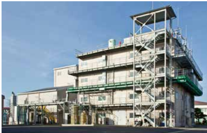
有機ヨウ素化合物製造設備 Organic Iodine Compound Manufacturing Facility 各種の有機ヨウ素化合物をはじめ、さまざまなニーズに対応するためのマルチ製造設備を備えています。 This facility is equipped with multiple production equipments to meet a variety of needs including production of a full array of organic iodine compounds.

Organic iodine compounds are indispensable materials used in a variety of fields including medical products, photographic chemicals and information technology equipment. In addition to these areas, in recent years we have been working to develop highly marketable organic iodine compounds in a wide range of fields. These new areas include compounds for use as environmentally conscious organic reactants that can act as substitutes for heavy metal oxides, as well as functional organic conjugates such as materials for organic electro-luminescence and for use in information recording materials. With our system for consistent production and technological development spanning contract manufacturing to proposal-based manufacturing, we provide comprehensive solutions for customers' various needs.