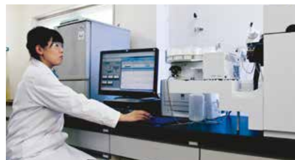
計量証明事業 Measurement and Verification Business

プロセス開発の各段階で、反応の最適条件や反応条件の安全性スクリーニングとして使用しています。 In every stage of process development, this device is used to monitor ideal reaction conditions and for screening of reaction safety conditions.