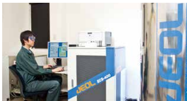
核磁気共鳴装置 (NMR) Nuclear Magnetic Resonance (NMR) Spectrometer

各種ヨウ素化合物製品の開発とヨウ素リサイクル技術向上に取り組んでいます。 We strive for the development of various iodine compounds and the improvement of iodine recycling technologies.