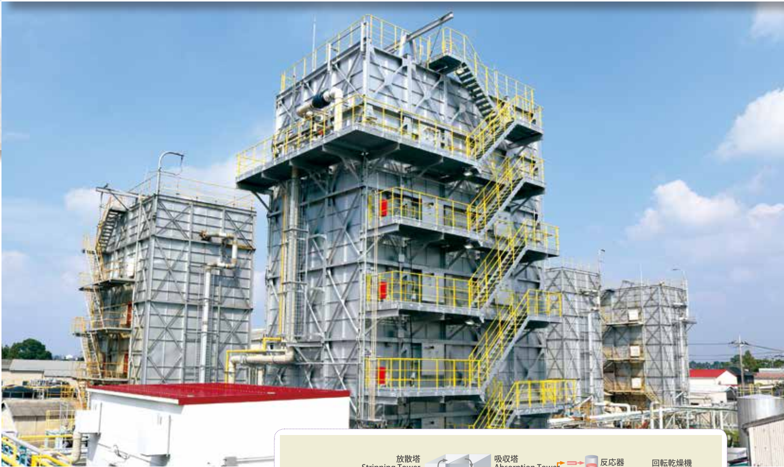
ヨウ素製造工場／Iodine Manufacturing Plant

ブローアウト法による製造工程 Manufacturing Process Using the Blow-Out Method かん水に塩素を加えて、ヨウ素イオンを分子に変化させます。このかん水を放散塔で散布、遊離したヨウ素をブローアウト（追い出し）し、吸収塔で吸収・濃縮します。吸収液を塩素と反応させて結晶を析出、精製を行います。